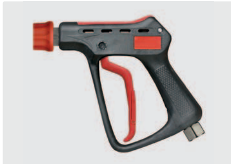
Professionelle Höchstdruckpistole mit Kupplung ST-45. Max. 600 bar / 80 l/min / 150 °C