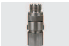
1/2" AG : 1/2" IG. Max. 600 bar