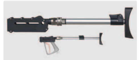
ST-3900 Schulterstützen. Neue EU-Richtlinien schreiben den Gebrauch von Schulterstützen bei Arbeiten mit einer Rückstoßkraft von mehr als 150 N zwingend vor. Stufenlos verstellbare Schulterstütze. Drehbare Kupplung. Geeignet für alle Pistolen ST-3600.