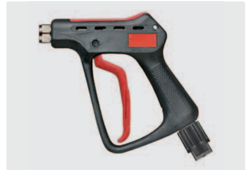
Professionelle Höchstdruckpistole. Max. 600 bar / 80 l/min / 150 °C