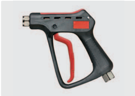
Professionelle Höchstdruckpistole. Max. 600 bar / 80 l/min / 150 °C