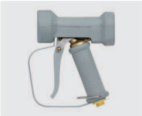
Pistole mit stufenloser Spritzwinkelveränderung. Sicherungsbügel. Max. 24 bar / 100 l/min / 50 °C