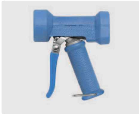
Pistole mit stufenloser Spritzwinkelveränderung. Max. 24 bar / 100 l/min / 50 °C