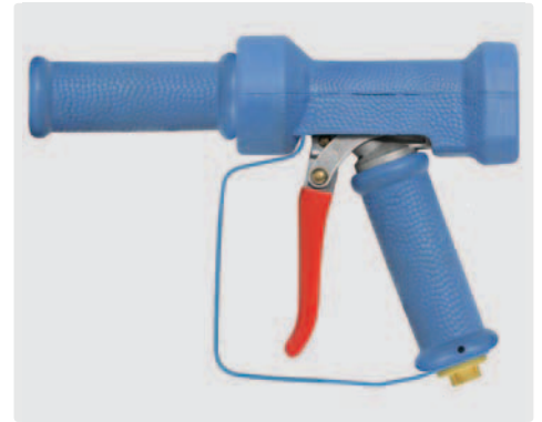
Pistole mit stufenloser Spritzwinkelveränderung. Sicherungsbügel. Max. 24 bar / 100 l/min / 95 °C