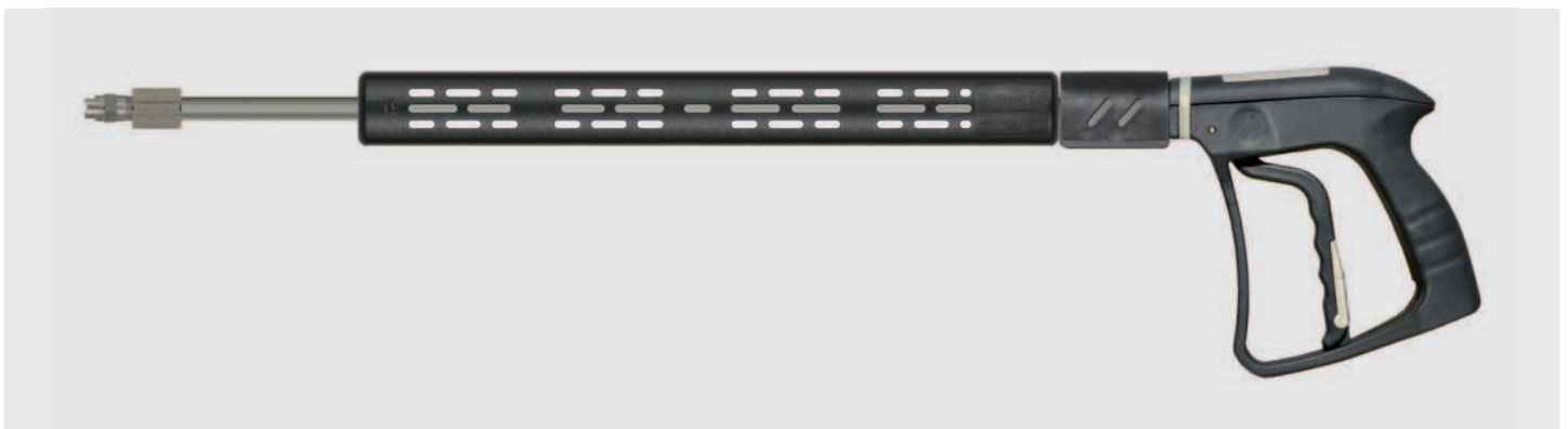
Professionelle Dampfpistole ST-4000 mit Lanze aus Edelstahl 500 mm, Isolierung ST-9 380 mm und Dampf-Niederdruckdüse aus Edelstahl. Max. 20 bar / 200 °C