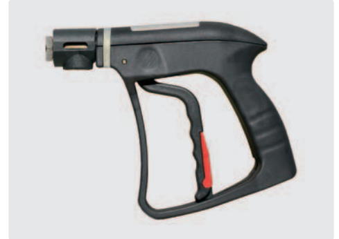
Professionelle Dampfpistole ST-860D. Messing. Max. 20 bar / 200 °C