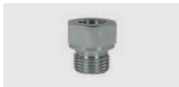
Sechskant. Stahl verzinkt