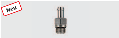
Tülle 9 mm : M14 AG. V4A Extreme. Höchste Chemiebeständigkeit. Mit O-Ring