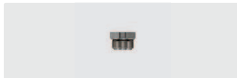
M18 AG. Druckluftanschluss (ST-164 & ST-168). Mit O-Ring