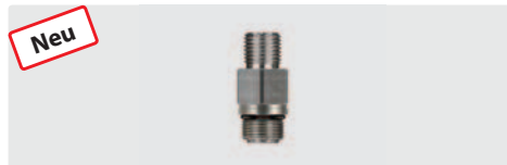
1/4" AG : M14 AG. V4A Extreme. Höchste Chemiebeständigkeit. Mit O-Ring