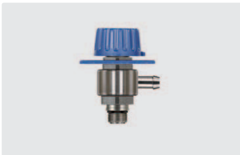
Tülle 9 mm : M14 AG. Dosierventil ST-161 zum Nachrüsten für easyfoam365+ Injektoren (ST-160, ST-166, ST-164, ST-167 und ST-168)