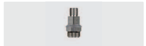
1/4" AG : M18 AG. Druckluftmodul (ST-164). Mit O-Ring