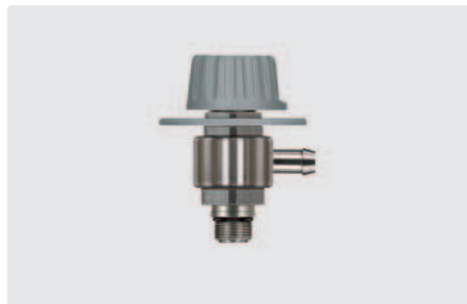
Tülle 9 mm : M14 AG. Dosierventil ST-161 zum Nachrüsten für easyfoam365+ Injektoren (ST-160, ST-166, ST-164, ST-167 und ST-168)