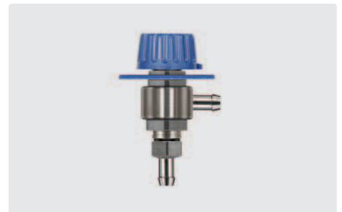
Tülle 9 mm : Tülle 9 mm. Paneleinbau ist möglich