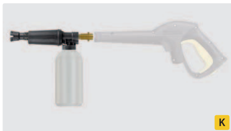
Bajonett K. Messing. Schauminjektorlanze mit Dosierung und Flasche. Max. 300 bar / 80 °C