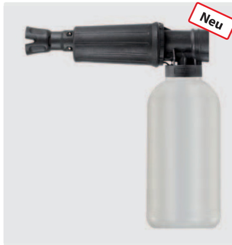
1/4" IG. Schauminjektorlanze mit Dosierung und Flasche. Max. 300 bar / 80 °C