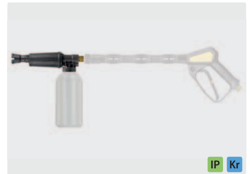
M22 AG. Schauminjektorlanze mit Dosierung und Flasche. Max. 300 bar / 80 °C