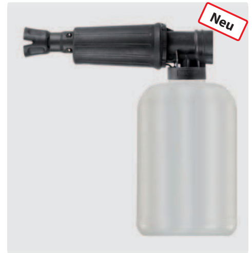
1/4" IG. Schauminjektorlanze mit Dosierung und Flasche. Max. 300 bar / 80 °C