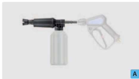
Stecknippel KW. Schauminjektorlanze mit Dosierung und Flasche. Max. 300 bar / 80 °C