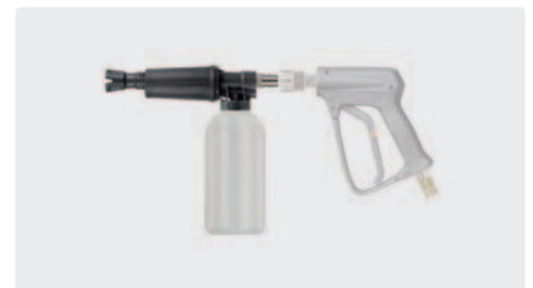
ST-45-250 Edelstahl. Schauminjektorlanze mit Dosierung und Flasche. Max. 300 bar / 80 °C