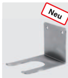
Wandhalter. Edelstahl. 68 mm x 95 mm. Inkl. Befestigungsmaterial