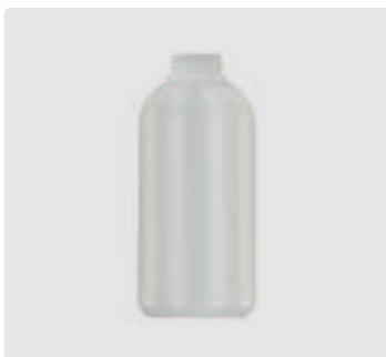
Ersatzflasche 1 Liter