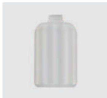
Ersatzflasche 2 Liter