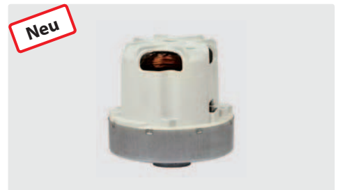
1-stufig. 230 V / 50 Hz. Kabel beigelegt. Mit Thermoschalter