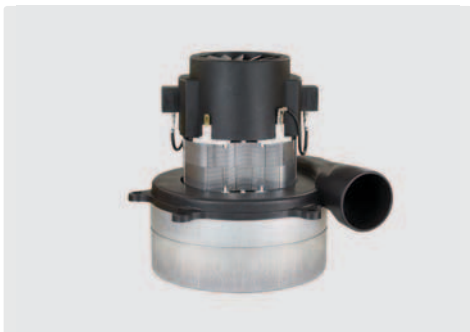
2-stufig mit Abluftrohr. 230 V / 50 Hz. Kabel vorinstalliert