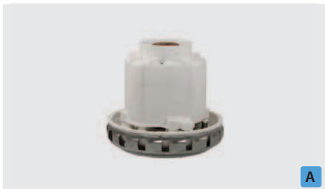
1-stufig. 230 V / 50 Hz. Kabel vorinstalliert