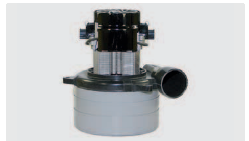
3-stufig mit Abluftrohr. Kabel vorinstalliert. 262 064 113 : 24 V. 262 074 113 : 36 V