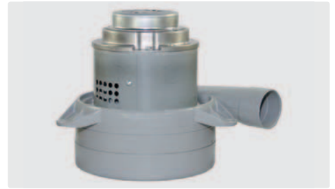
3-stufig mit Abluftrohr. 230 V / 50 Hz. Kabel vorinstalliert