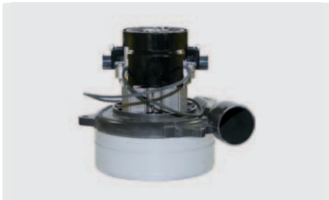
2-stufig mit Abluftrohr. 24 V. Kabel vorinstalliert