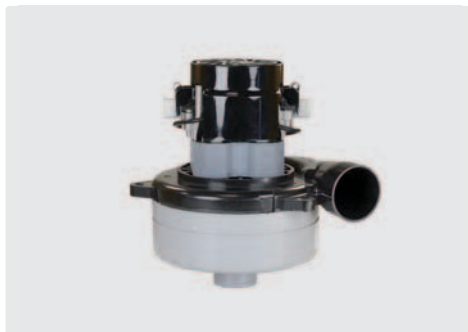
2-stufig mit Abluftrohr und Stutzen. 24 V. Kabel vorinstalliert