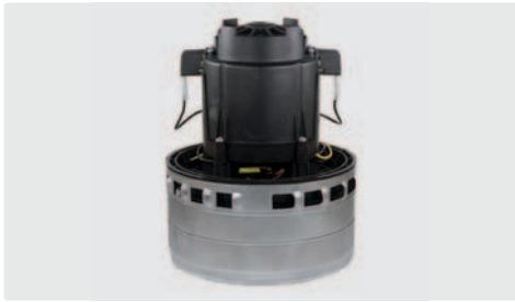
3-stufig. 230 V / 50 Hz. Kabel vorinstalliert