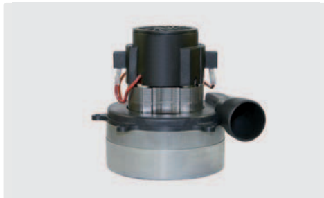
2-stufig mit Abluftrohr. 24 V =. Kabel vorinstalliert