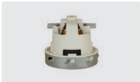
1-stufig. 230 V / 50 Hz. Ohne Kabel, (Kabeltyp 1 optional)