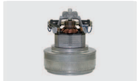
2-stufig. 230 V / 50 Hz. Kabel vorinstalliert